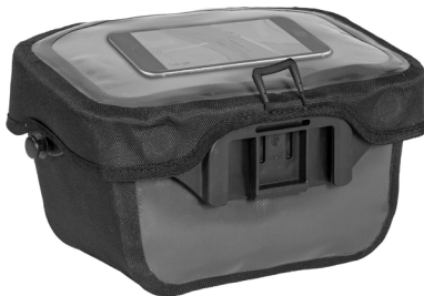
Smartphone im transparenten Deckelfach (nicht enthalten)