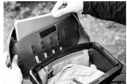
Öffnung Deckelfach: 21,5 cm