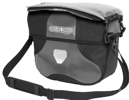
Befestigungsmöglichkeit für die Kartentasche Ultimate Six Map-Case (separat erhältlich)