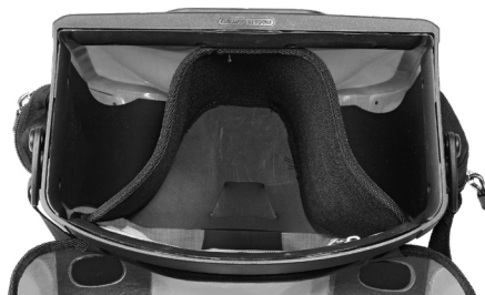
Innentaschenunterteilung Ultimate Six Internal Divider (separat erhältlich)