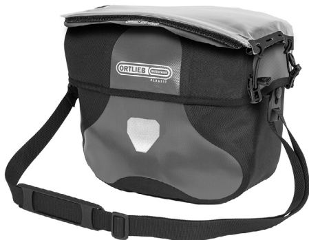
Befestigungsmöglichkeit für die Kartentasche Ultimate Six Map-Case (separat erhältlich)