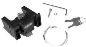
E185 Handlebar Mounting-Set with Lock