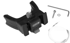
E226 Handlebar Mounting-Set E-Bike