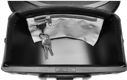
Karabiner mit Schlüsselbund