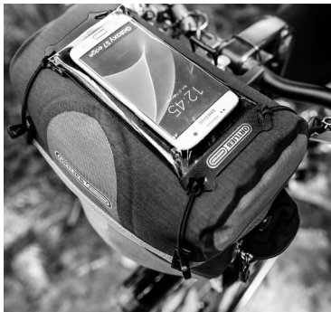
Befestigungsmöglichkeit für Safe-It (separat erhältlich)