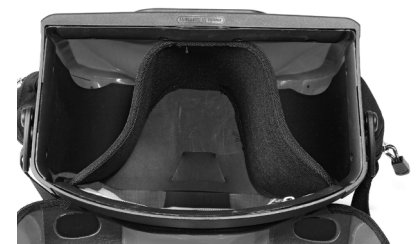
Innentaschenunterteilung Ultimate Six Internal Divider (inkl.)