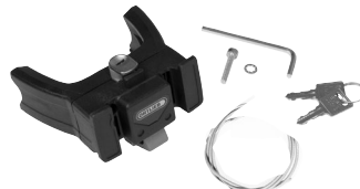
E207 Handlebar Mounting-Set E-Bike with Lock