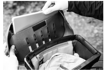
Öffnung Deckelfach: 21,5 cm