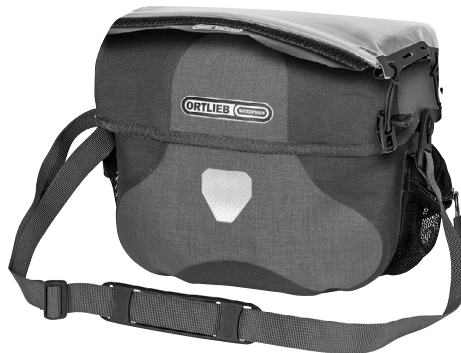
Befestigungsmöglichkeit für die Kartentasche Ultimate Six Map-Case (separat erhältlich)