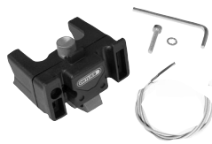
E225 Handlebar Mounting-Set