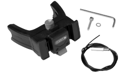
E226 Handlebar Mounting-Set E-Bike