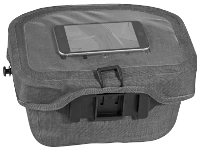
Smartphone im transparenten Deckelfach (nicht enthalten)