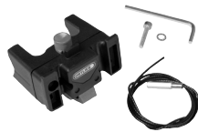
E225 Handlebar Mounting-Set