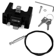
E185 Handlebar Mounting-Set with Lock