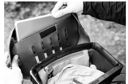
Öffnung Deckelfach: 20,5 cm