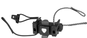
E241 Handlebar Mounting-Set QR