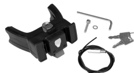
E207 Handlebar Mounting-Set E-Bike with Lock