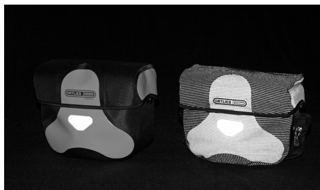
Vergleich: Ultimate Six Classic (links), Ultimate Six High Visibility (rechts)