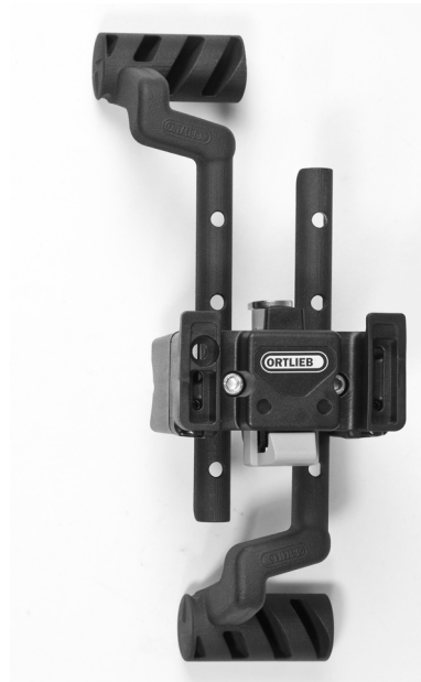
Option Montage Adapter