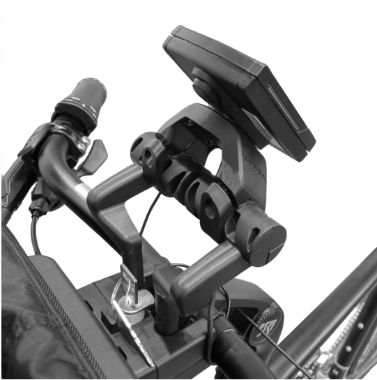
Montage E-Bike Display